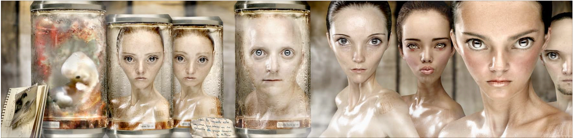
Manuel Santos. "Aliens, somos un experimento del propio universo", 2004 / 1 pieza / 74 x 263 cms / impresión digital / montaje en bastidor sobre marco recubierto de poliéster

Verticalidad de líneas paralelas delimitando áreas voluminosas que separan figuras pseudo-antropomórficas; predominantes colores cálidos de piel armonizando con el fondo. Una línea ondulante horizontal de círculos con altas luces cada uno, representando los ojos de cada sujeto con excepción del primero.